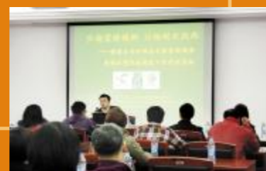
▲开展学习雷锋咨询服务活动