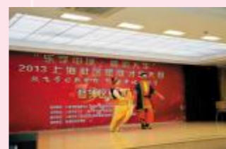
▲长白《库尔班大叔你上哪》