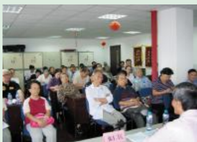
▲论坛听众济济一堂

在2010年，根据实践撰写的论文被市委宣传部等7家单位评为“上海市坚持和发展中国特色社会主义理论研讨征文”十佳之一，成为理论阵地上唯一的基层社区著述；2012年被市委宣传部评为上海市基层优秀宣讲集体。在实践和理论两个方面同步推动学习团队的持续发展，成为该报告团的又一亮丽风景线。