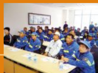
▲开展农民工技能培训