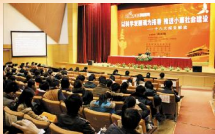
▲邀请专家做客“杨浦大讲坛”解读十八大报告

近年来，杨浦区人力资源和社会保障局紧紧围绕国家创新型试点城区建设目标，按照创建学习型组织要求，大兴学习之风，勇闯实践之路，通过加强领导，建章立制，增强学习的推动力；培养理念，营造氛围，激发学习的内动力；创新形式，丰富内容，提升学习的吸引力；加强管理，完善机制，增强学习的规范力等方面，全面推进学习型组织建设，为杨浦人力资源和社会保障事业持续健康发展提供思想、组织保证和智力支持。