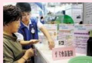
▲教市民巧辨优劣食品