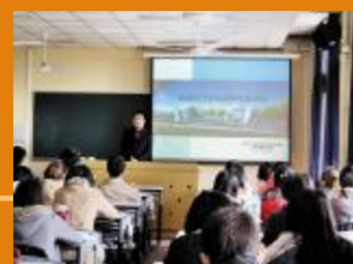
▲积极开展创业政策宣讲