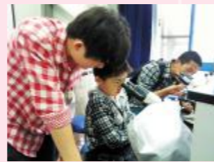
▲工作站开放日活动