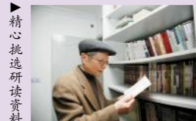
▶精心挑选研读资料

“倡导终身学习,在学习中生活,在生活中学习”是读报组开展活动的宗旨。老人们相聚一起读报、评报,既了解了国家、社区中的大小事,又可以结交很多老年朋友,读报活动丰富了老年人的生活,让老年人得到精神上的满足。读报组除了每月两次的例行读报、文明宣传活动外,还在居委会的协助下,经常邀请居住在社区内的律师、教师和医生为他们开设讲座,既丰富了活动内容,又普及了法律、健康知识,受到读报组成员的欢迎。形式多样、丰富多彩的读书活动,使老年人在社区这所大学校里的生活更充实、更健康、更快乐。