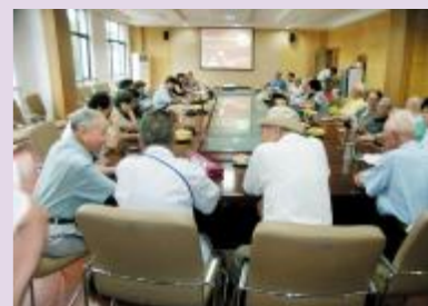
▲《星之光》的编委来自于社区读书沙龙的成员