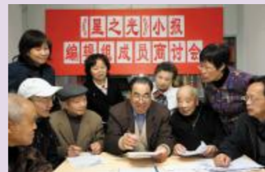
▲编辑部成员认真商讨每一期内容

《星之光》为居委会与居民之间提供了一个相互交流、传递信息的窗口,成为居委会和居民联系、沟通的桥梁和纽带。增强了居委的凝聚力和号召力,为进一步做好社区管理和服务工作提供可靠的依据和有力的保障。