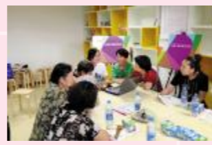
▲为居民进行营养测试