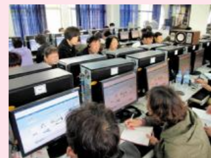
▲居委干部网上学习

培训内容主要有：社区工作中基本的法律法规政策、新形势下社区管理干部的任务和策略、建设居民终身学习共同体，促进和谐社区建设、居委领导团队协作管理的策略、打造学习型居委会，建设和谐社区、在社区管理中与居民建立良好信任关系的技巧、社区管理中领导的沟通技巧与方法等。