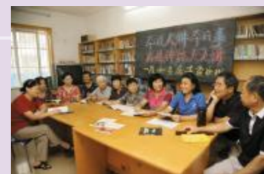
▲“爱我家园”读报组大家庭

“倡导终身学习,在学习中生活,在生活中学习”是读报组开展活动的宗旨。老人们相聚一起读报、评报,既了解了国家、社区中的大小事,又可以结交很多老年朋友,读报活动丰富了老年人的生活,让老年人得到精神上的满足。读报组除了每月两次的例行读报、文明宣传活动外,还在居委会的协助下,经常邀请居住在社区内的律师、教师和医生为他们开设讲座,既丰富了活动内容,又普及了法律、健康知识,受到读报组成员的欢迎。形式多样、丰富多彩的读书活动,使老年人在社区这所大学校里的生活更充实、更健康、更快乐。