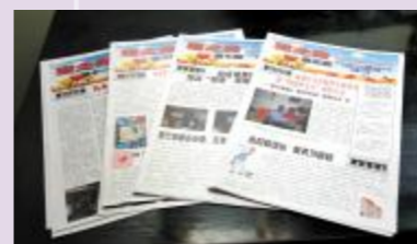
▲内容丰富、图文并茂的《星之光》

殷行街道工农三村第二居委会的《星之光》小报创办于 2004 年 4 月,由社区读报小组的同志作为志愿者负责编辑和发行工作。