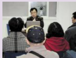
▲军校研究生宣讲团进社区