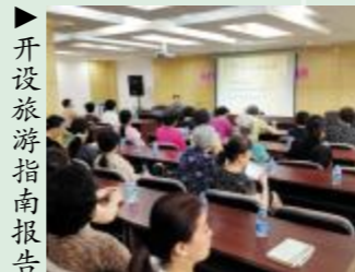
▶开设旅游指南报告