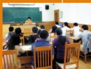
▲积极开展沪语培训