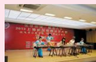
▲五角场镇《古筝表演》