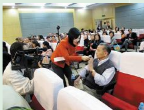
▲杨浦有线台采访居民

四平社区“心海小筑”团队始建于2006年，是街道家庭文明建设指导中心根据社区居民需求推出的公共服务项目，一路走来，已吸纳并逐步形成了一支具有国家二级心理咨询师资质的志愿者服务团队。团队成员共14人，他们中有还在上班的白领、自己开公司的创业者、社区退休志愿者和街道在职员工，或专职，或兼职，不计名利报酬，充分发扬“助人自助”的志愿者服务精神，以扎实的心理学理论基础和丰富的心理咨询工作经验，为社区居民提供免费心理咨询服务，帮助他们疏情理结，将小矛盾化解于萌芽，得到广泛好评与欢迎。社区“心海小筑”团队已多次获得市、区“巾帼文明岗”、“文明窗口”等荣誉称号。