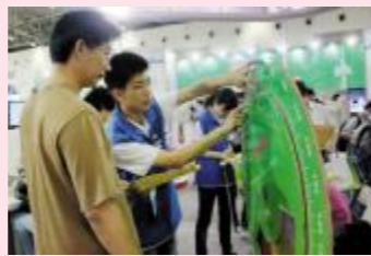
▲市民参与“BMI指数”测试

通过这些科普平台以及系列科普宣传活动，使社会在共享高校的科技成果的同时，在全社会形成爱科学、学科学、用科学的良好风尚，切实提高了社区居民的科学素养。