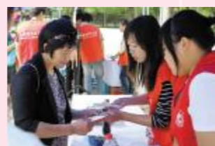
▲食品安全知识答疑