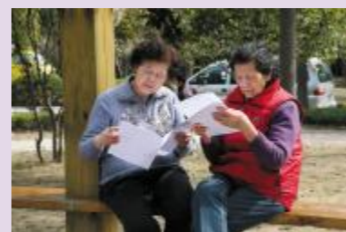
▲社区居民在小区花园里读报