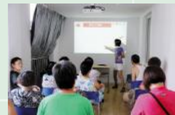
▲普及食品药品安全知识